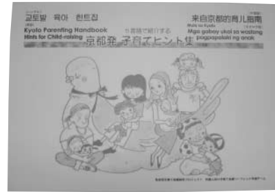
【乳幼児子育て支援研究プロジェクト実行委員会】 京都子育てネットワーク、NPO法人京都子どもセンター、社会福祉法人京都市社会福祉協議会、京都市私立幼稚園PTA連合会OB会「はのんの会」、NPO法人山科醍醐こどものひろば、京都市子育て支援総合センターこどもみらい館

難しい、しんどいと感じられた時の一助になればと、各保育所・幼稚園、子育て支援センター、区役所などに置いています。必要な方には、コピーをお渡しし活用していただいています。